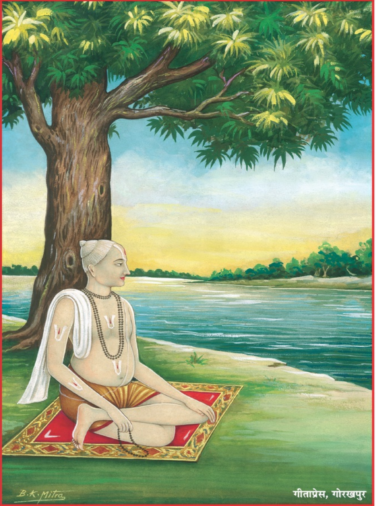
गोस्वामी श्रीतुलसीदासजी महाराज